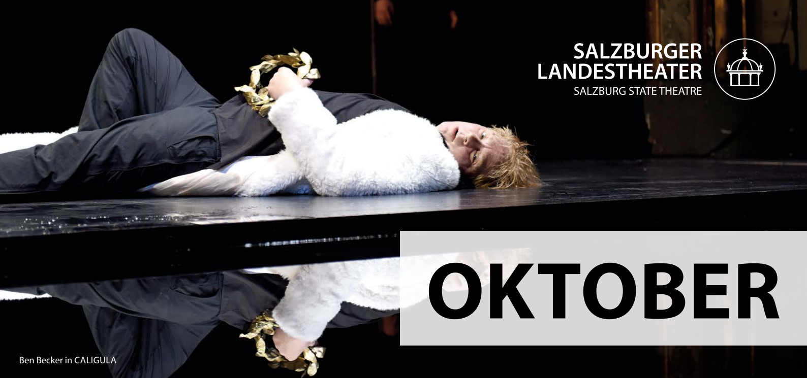
Ben Becker in CALIGULA