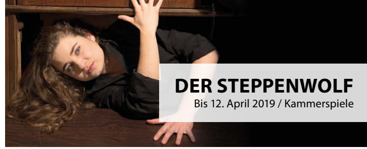
DER STEPPENWOLF Bis 12. April 2019 / Kammerspiele

Kammerspiele 19.30 DER STEPPENWOLF SCHAUSPIEL Hermann Hesse Preise L Schauspiel III Abo freier Verkauf