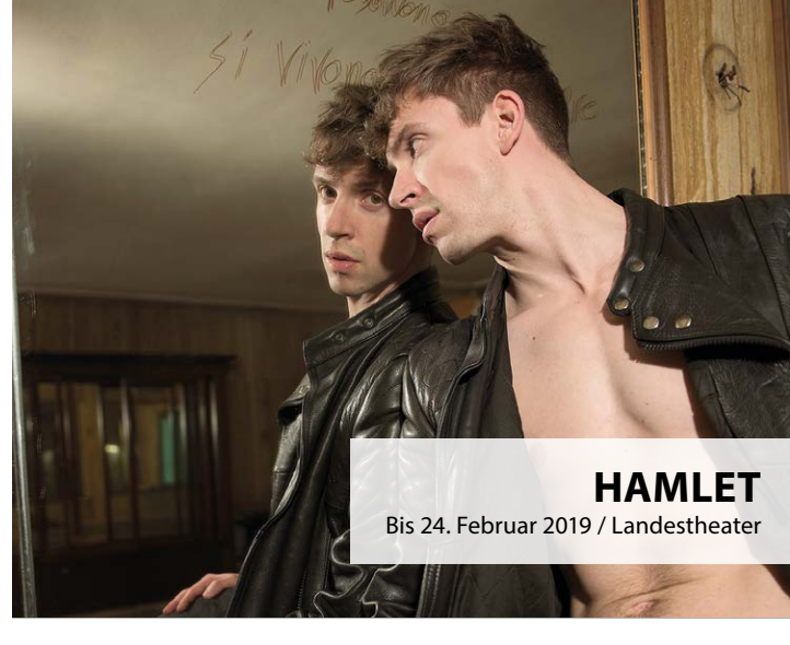
HAMLET Bis 24. Februar 2019 / Landestheater

Kammerspiele 19.30 DER STEPPENWOLF SCHAUSPIEL Hermann Hesse Preise L Schauspiel IV Abo freier Verkauf