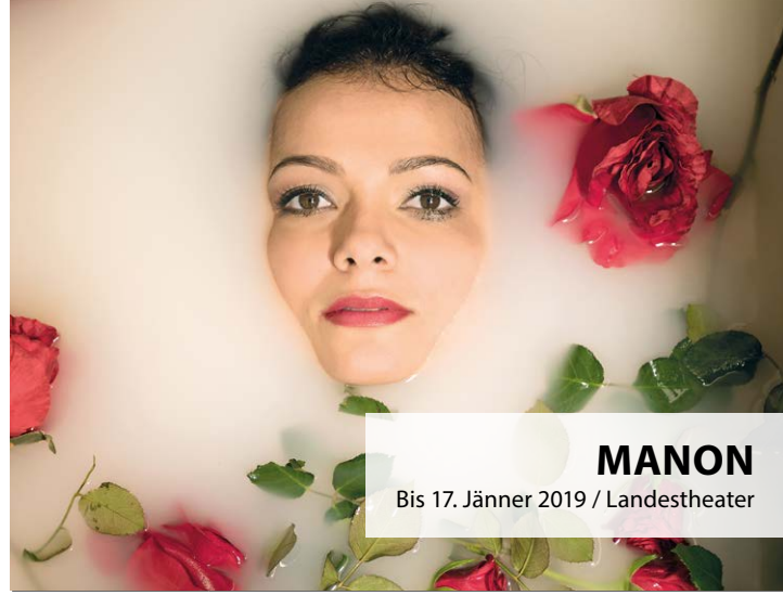
MANON Bis 17. Jänner 2019 / Landestheater

Kammerspiele 19.00 WIESCHKE SINGT DEUTSCH SCHAUSPIEL Ein szenischer Liederabend Preise L Kammerspiel I Abo freier Verkauf